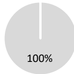
2. Investissements alignés sur la Taxinomie excluant les obligations souveraines*