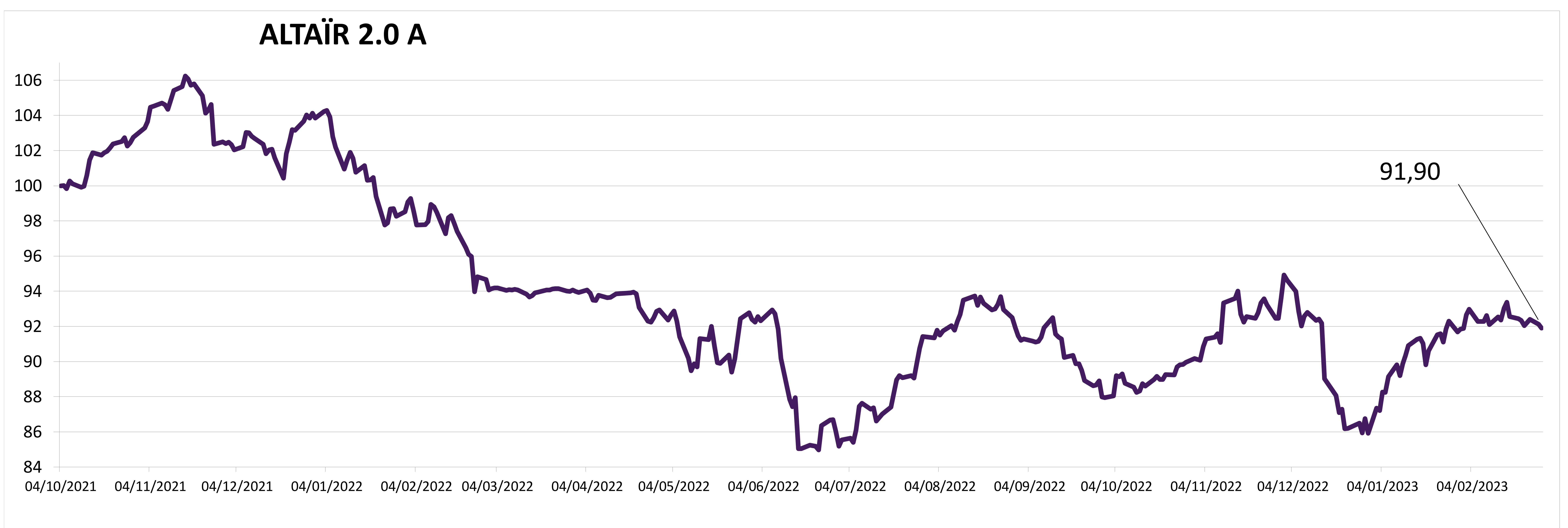
- ALTAÏR 2.0

Evolution de la valeur liquidative : base 100 le 04/10/2021